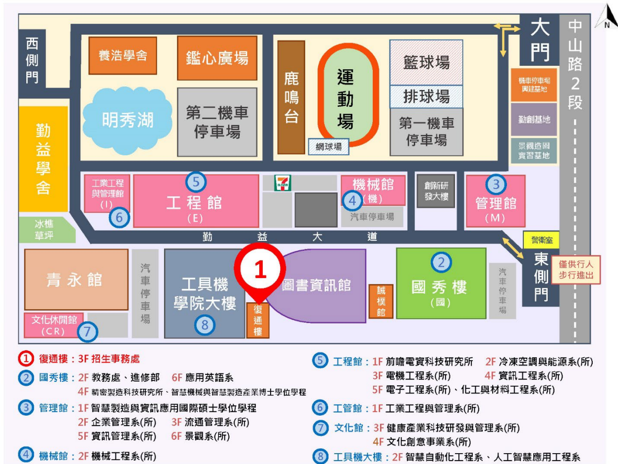
圖 2 校園位置圖