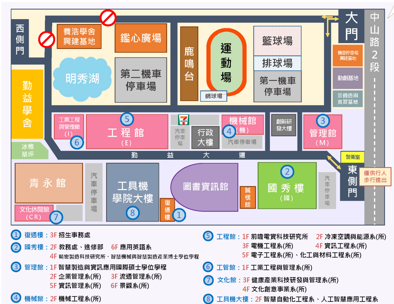
圖 2 校園位置圖